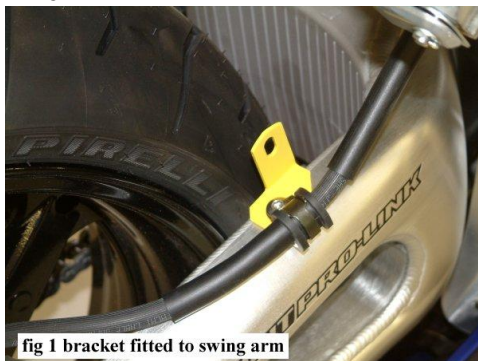
fig 1 bracket fitted to swing arm